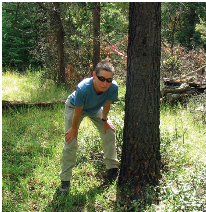
Le Programme offre de l'aide aux propriétaires de terres forestières privées.

Forestry Liaison Officers from Natural Resources Canada are available to discuss possible treatments, eligible activities, requirements and how to apply for funding through the program.