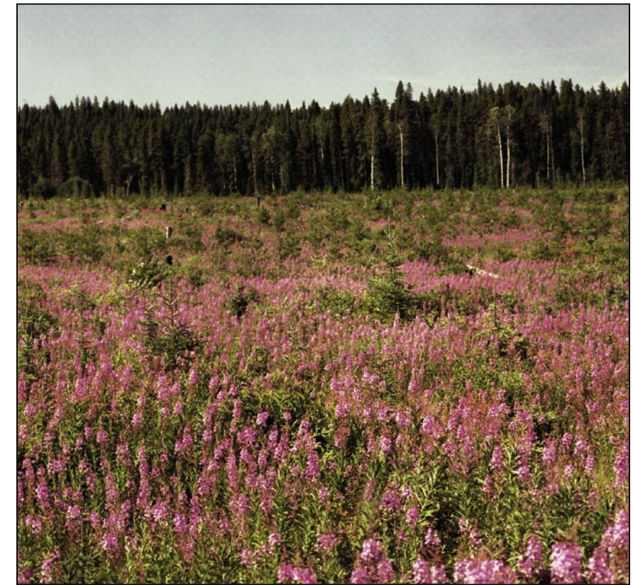
Le Programme soutient des pratiques forestières durables.

Un maximum de 10 p. 100 des fonds attribués peut être utilisé pour la gestion et l'administration du projet, et un maximum de 5 p. 100 peut être consacré à l'achat d'équipements mineurs.