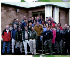
• Victoria, British Columbia / Colombie-Britannique (2004) 30 participants