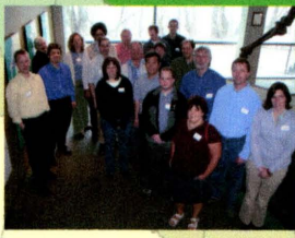
• Winnipeg, Manitoba (2006) 15 participants