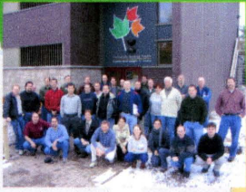
• Mattawa, Ontario (2003) 28 participants