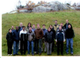
• Corner Brook, Newfoundland & Labrador / Terre-Neuve-et-Labrador (2005) 15 participants