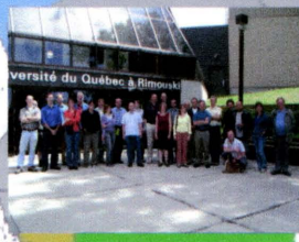
• Rimouski, Quebec / Québec (2006) 26 participants