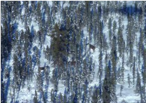
Partie de l'aire d'hivernage de la harde de caribous de la forêt Nagagami

Dans la Communauté forestière du Nord-Est du lac Supérieur , la scierie Olav Haavaldsrud Timber Company Ltd., située à Hornepayne, était sur le point de perdre un volume de récolte considérable. Le territoire d'approvisionnement de la scierie comprenait une partie du domaine vital de la harde de caribous de Nagagami.