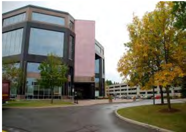
Tour B de l'immeuble Qualicum

Toutes les adresses postales et tous les numéros de téléphone demeurent les mêmes. Toutefois, si vous souhaitez nous rendre visite en personne, rendez-vous à la Tour B, sur le chemin Baseline. Vous pouvez utiliser le téléphone dans l'entrée pour appeler, et quelqu'un viendra vous rencontrer. Notre retour au 580, rue Booth est prévu au début de la nouvelle année.