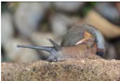
Escargot géant africain

Pour de plus amples renseignements sur l'exposition Les femmes de la forêt au Cameroun , veuillez visiter le site web du Musée de la civilisation à Québec .