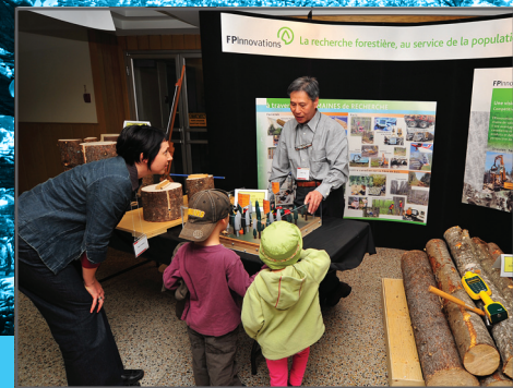
Des visiteurs enthousiastes!