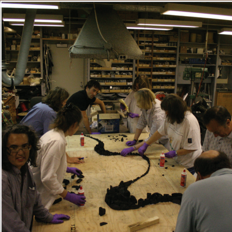
Les « artistes » à l'œuvre