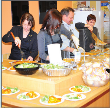
Les cuisistos d'un jour

Les membres du Conseil de gestion désiraient remercier les employés en les conviant à un repas de lasagne lors de la date anniversaire du CFL, le 12 février 2010. Ils ont servi plus de 130 repas et ont eux-mêmes préparé les desserts qui étaient aussi beaux que succulents!