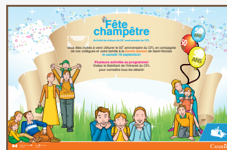
Affiche de la fête champêtre du CFL