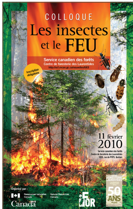
Affiche réalisée pour l'édition 2010 du colloque Colloque Les insectes et le feu