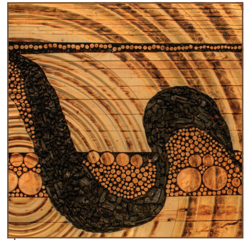
Reflet d'histoire est exposé dans le hall d'entrée du CFL Photo : Gervais Pelletier.

Des copies du DVD « Making of » de l'œuvre, réalisé par Robert Lavallée, ont été distribuées aux employés.