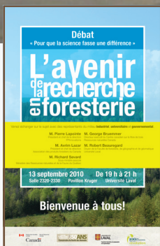
Affiche du débat sur la recherche

Afin de donner suite à cette soirée débat, le CFL prévoit organiser un colloque sur le même thème dans le cadre du Carrefour Forêt Innovations en collaboration avec le ministère des Ressources naturelles et de la Faune du Québec et ses principaux partenaires en octobre 2011, carrefour qui s'inscrit dans l'Année internationale de la forêt.