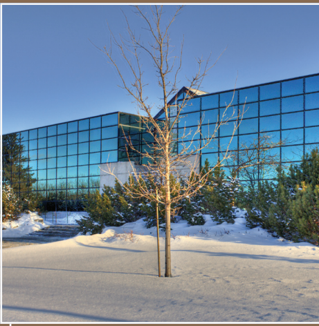
Centre de foresterie des Laurentides, Québec