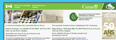
Publicité réalisée pour les portes ouvertes du CFL Paru dans un encart spécial Le Soleil