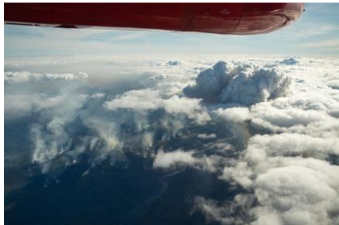
Nuage de fumée au-dessus de Fort McMurray, Alberta, mai 2016.