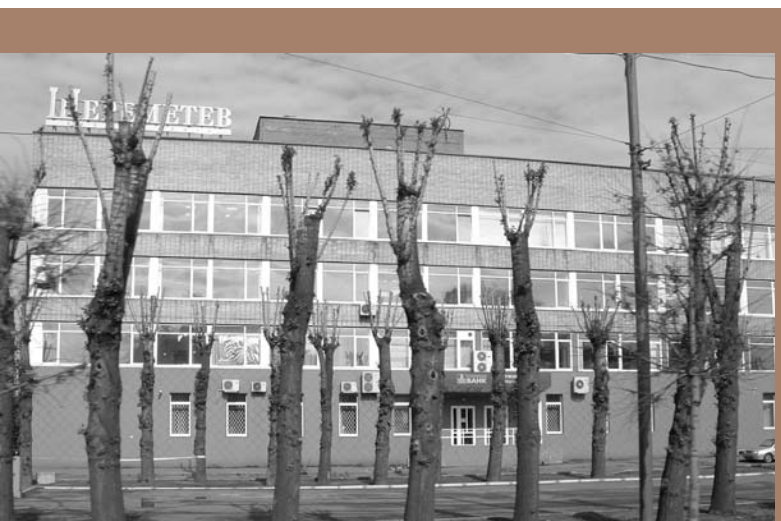
La foresterie urbaine semble être prise au sérieux en Russie en constatant l'ampleur de certains projets comme l'élégage des peupliers. Ceux-ci sont très utilisés en ville comme arbre d'enlignement et on les rabat périodiquement.